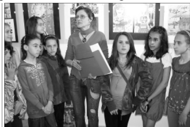
Малките художници от школата при Читалището участваха в 18 национални и международни състезания и представиха 4 свои изложби в Севлиево

През изминалата година децата участваха в национални пленери в Боженици, Тръстеник, в детската Аполония в Созопол. Техни творби бяха представени не само в национални изложби, но и в такива, провели се в Македония, Чехия, Полша, Индия и Беларус. Продължава на стр. 5