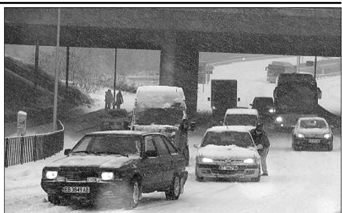
Автомобил с габровска регистрация е закъсал на един от пътните възли във В. Търново. Заради недовбре почиствените пътища Агенция „Пътна инфраструктура“ глоби снегопочистващата фирма на републиканските шосета във Великотърновско. В Габровска област няма глобени дружества, несправили се със зимната обстановка

Тежкотоварните превозни средства над 10 т, превозващи храна, горива и медикаменти, ще бъдат ескортирани от патрулни коли. Съответният превозвач ще трябва да отправи искане до съответното Областно пътно управление.