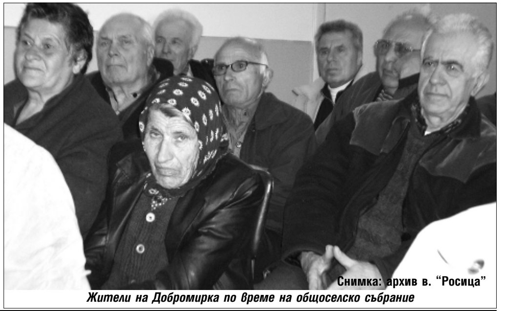
Жители на Добромирка по време на общоселско събрание

докато очакванията на населението в селата остават почти без промяна. Потребителите продължават да смятат, че през последните дванадесет месеца има покачване на потребителските цени. По отношение на безработицата в страната предвижданията на живеещите в област Габрово също не са розови. Хората категорично са отчели, че очакват масови съкращения в следващите месеци, респективно покачване нивото на безработица в региона.