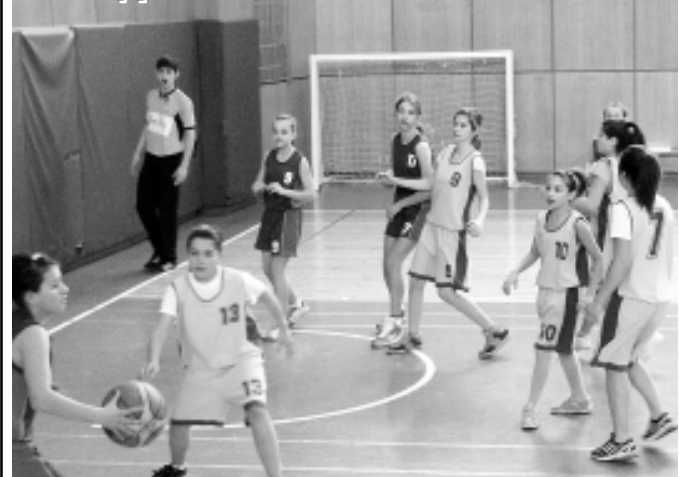
Момичетата до 14 г. от „Раковски“ не успяха да се класират за зоните

С две болни състезателки и една отсъстваща по семейни причини, отборът на момичетата до 14 години от клуба по баскетбол „Раковски“ трябва да защитава името си в последния кръг от междуобластното първенство. В тази възрастова група на наш терен в спортна зала „Дан Колов“ миналата неделя се срещнаха съставите на „Зограф“-Трявна,