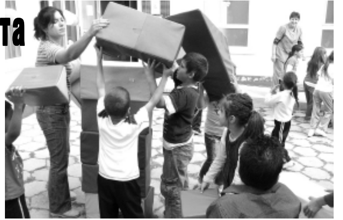
В нашата община децата с увреждания са близо 100, а около 30 от тях посещават Дневния център

мо в нашата община децата с увреждания наброяват близо 100. Около 30 от тях посещават Дневния център за деца и младежи с увреждания, като някои са там целодневно, а други ползват само почасови услуги на логопед, рехабилитатор и др. Едва 29 от всички тях пък са интеригирани в масовото училище.