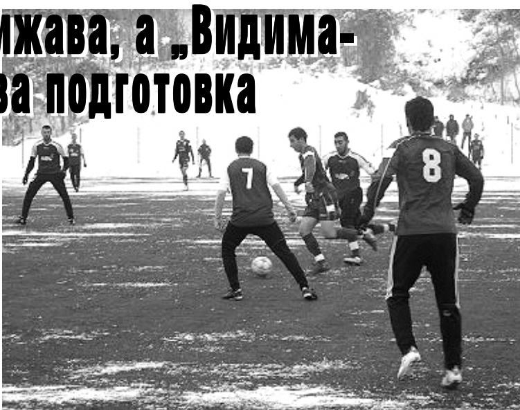
Днес „Видима“ трябва да играе контрола със „Спартак“-Пл в Ловеч, но не е изключено да пропадне заради снега