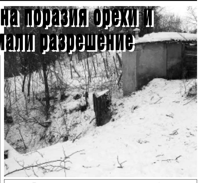
Дънерите на прясно отрязаните дървета

ТАТЯНА МИЗИНОВА До пролетта от дърветата по пътя за Крушевския баир може и да не остане нищо. От няколко дни роми секат на поразия салкьми, под брадвите им вече падна и един орех. За незаконната сеч се убеди на място и репортер на в. „Росица“. На въпроса имат ли право да повалят такива големи дървета, отсреща доста убедително отговори, че имат разрешително от Общината. Продължава на стр. 2